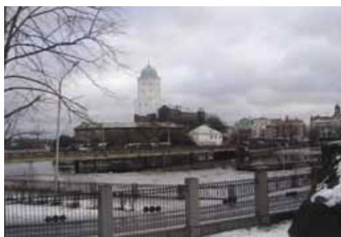
Место проведения семинара - Выборгский замок