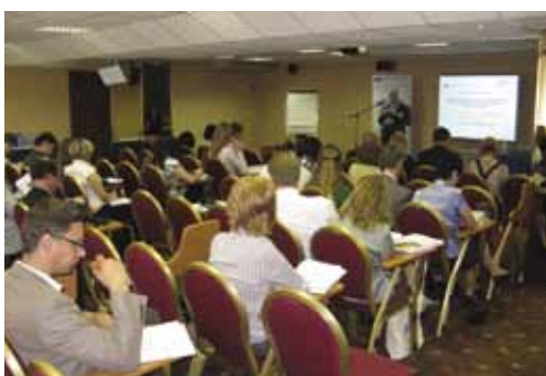
Участники семинара. Конференц-зал гостиницы «Меридиан»

Цель семинара — привлечь партнеров по сотрудничеству обоих регионов для обмена опытом, а также для оценки перспектив регионального развития и молодежной политики. Партнеры проекта из Санкт-Петербурга, Ленинградской области, Республики Карелия, Псковской, Калининградской и Мурманской областей, а также Литвы, Норвегии и Финляндии приняли участие в мероприятии.