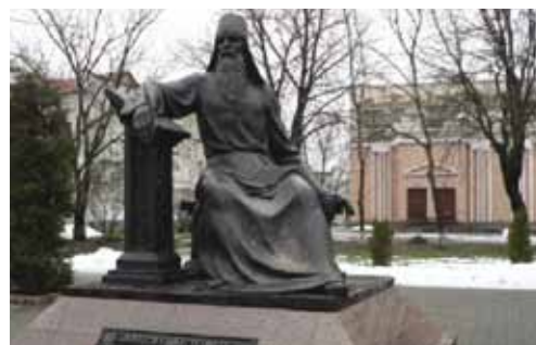
Экскурсия в Полоцк. Памятник Симеону Полоцкому

В результате оживленной дискуссии и обсуждений методов эффективной коммуникации приграничных структур со СМИ были выработаны рекомендации, дополнившие список рекомендаций партнерам проекта BEN, которые были приняты на семинаре по вопросам PR и информационной стратегии в приграничном сотрудничестве, прошедшем на острове Хиюмаа, Эстония, в апреле 2006 года. Рекомендации можно найти на сайте: http://www.beneast.net/docs/braslav_recomend_rus.pdf