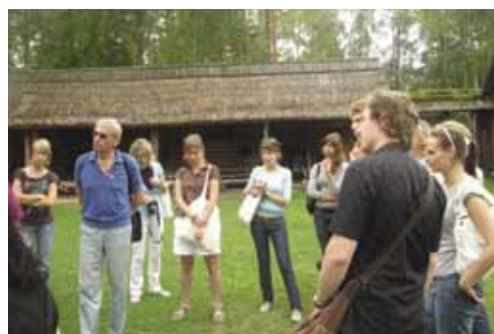
Экскурсия в музей Сету