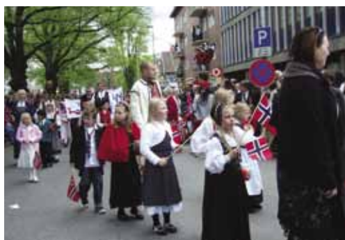
На праздновании Дня Независимости Норвегии (17 мая).