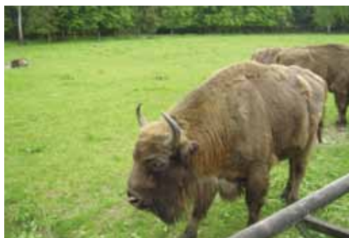
В Национальном парке «Беловежская пуща», Беловежа, Польша