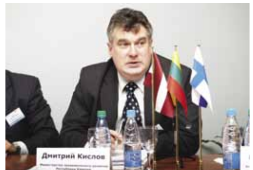
Д.С.Кислов, Заместитель министра экономического развития Республики Карелия.