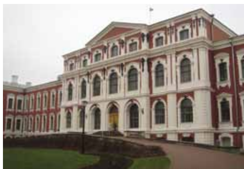
Место проведения конференции – Дворец Елгава