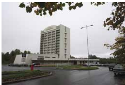
Туркомплекс «Карелия» - место проведения конференции