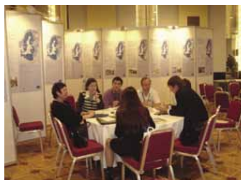
Интерактивное кафе по поиску партнеров