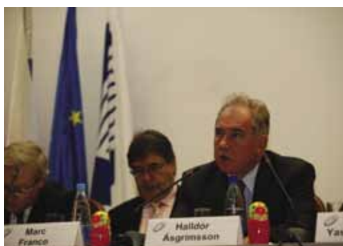
Выступление Генерального секретаря Совета Министров Северных стран Х.Аусгримссона.