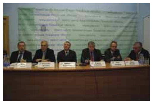
Во время пресс-конференции.