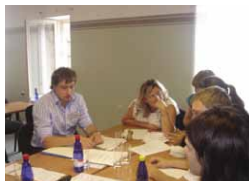
Работа над проектными идеями