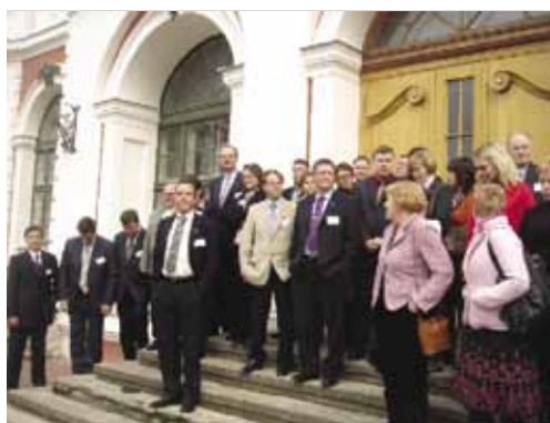
Представители партнерской сети проекта BEN