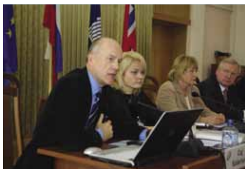
Выступление К.Сёдерлунда - старшего советника Министерства иностранных дел Финляндии.

Были представлены конкретные проектные предложения, а также продемонстрированы инвестиционные возможности Псковской области. Особое внимание было уделено возможностям дальнейшего развития экономического и политического сотрудничества России и Латвии.