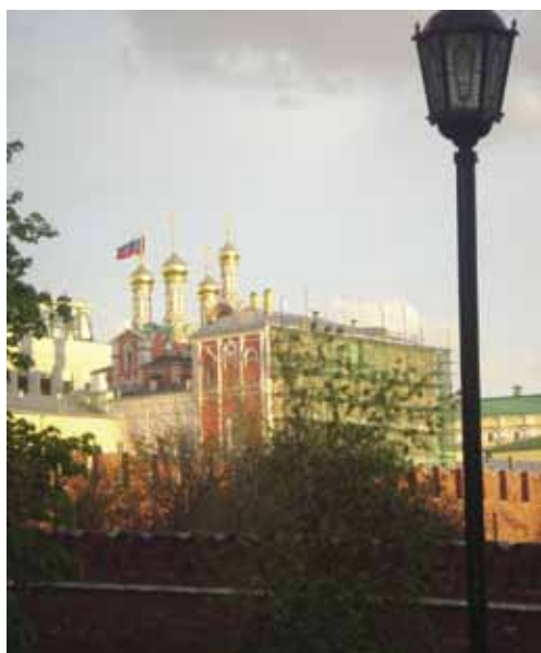
Москва. Конференция - открытие проекта