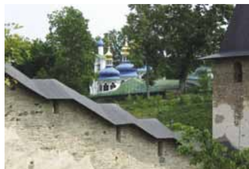
Печоры – место проведения мероприятий в рамках Летней школы.