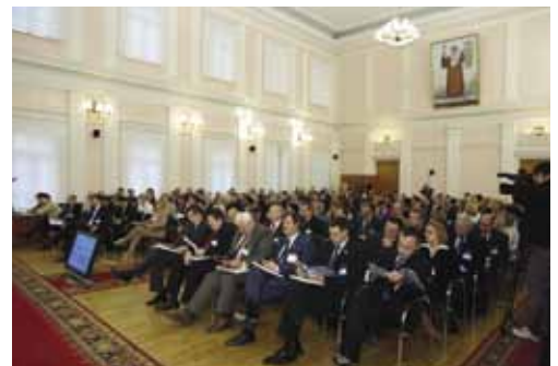
Пленарное заседание. Конференц-зал Администрации Псковской области.