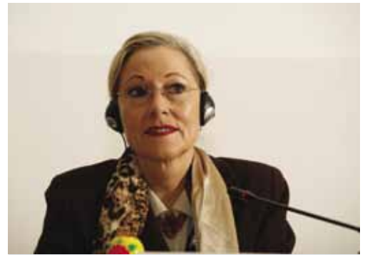
Член Европейской Комиссии Б.Ферреро-Вальднер.

По результатам проведения конференции и круглых столов были выработаны предложения участников по развитию приграничного сотрудничества в Российской Федерации, с ними можно ознакомиться на сайте: http://www.beneast.net/docs/kalinin_rec_rus.pdf