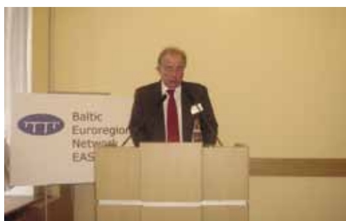
Выступление Генерального секретаря Совета министров Северных стран Х.Аусгримссона на открытии BEN-East

Проект BEN-East был открыт 24-25 мая 2007 года в Москве в Министерстве регионального развития РФ международной конференцией «Законодательная база и практика приграничного сотрудничества в Российской Федерации, Республике Беларусь и Европейском Союзе».