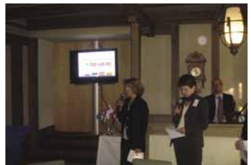
На приеме по случаю открытия конференции. Ресторан «Скандинавия»