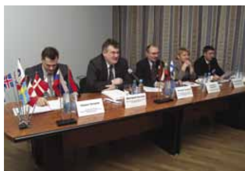
Президиум конференции.

Проект BEN-East завершился конференцией «Будущие модели приграничного сотрудничества в регионе Балтийского моря», которая прошла 11-12 декабря 2008 года в Петрозаводске, Республика Карелия, Россия. Конференция была организована Информационным Бюро Совета Министров Северных Стран в Санкт-Петербурге и Контактным центром в Петрозаводске совместно с Ассоциацией «Совет муниципальных образований Республики Карелия».