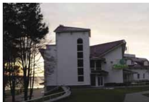
Место проведения семинара - база отдыха Дривяты