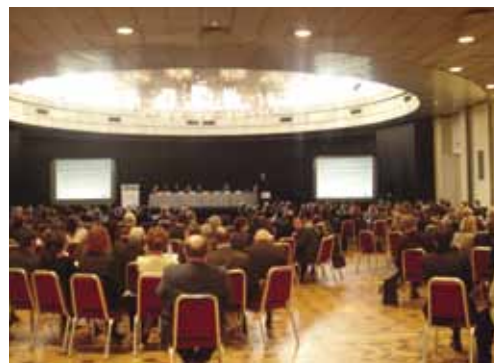
Пленарное заседание. Конференц-зал гостиницы «Парк Инн Прибалтийская»

В конференц-зале участники мероприятия смогли ознакомиться с выставкой проектов, демонстрирующей работу сотрудничества на практике. Кроме того, заявителям была предоставлена возможность получить консультацию экспертов Представительства Делегации Европейской Комиссии в Москве по текущим проектам, а также проконсультироваться у менеджеров Объединенного Технического Секретариата программ ИНТЕРРЕГ по новым проектным идеям.