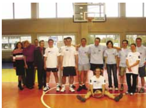
Участники мини-турнира по баскетболу