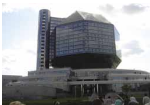
Экскурсия по Минску. Национальная библиотека Республики Беларусь