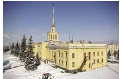
Железнодорожный вокзал Петрозаводска