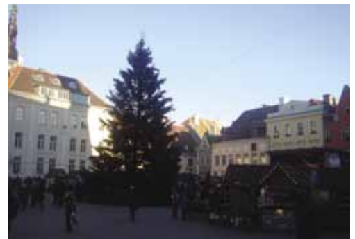
Таллин. Ратушная площадь