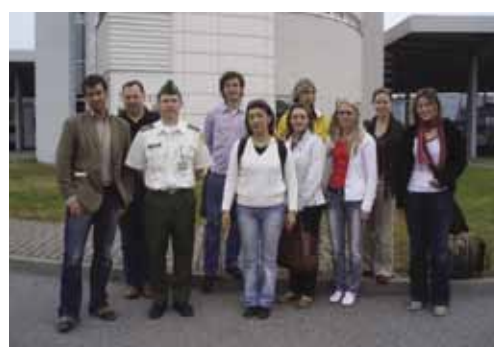
Посещение пограничного пункта пропуска Койдула.