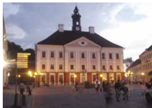
Ратушная площадь в Тарту

Подробнее о проведении Летней школы на сайте: http://www.ctc.ee/index.php?menu_id=695&lang_id=2