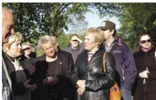
Участники семинара во Фредрикстаде.