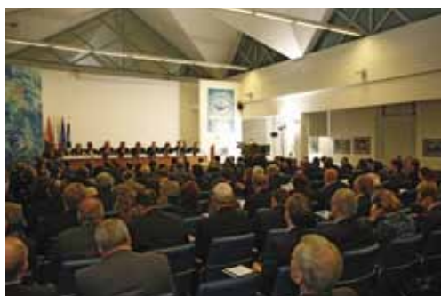
Пленарное заседание конференции. Музей Мирового океана.