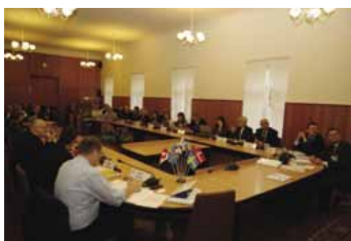
Круглый стол в рамках проекта BEN-East «Развитие туризма в приграничных регионах».

На круглом столе «Развитие туризма в приграничных регионах», который проводился в рамках проекта «Балтийская сеть Еврорегионов-Восток» (BEN-East), обсуждались особенности формирования и продвижения туристского продукта приграничных территорий, туристская инфраструктура, региональные целевые программы развития туризма, экологический и культурно-познавательный туризм, роль бизнес-структур, некоммерческих организаций, национальных, региональных и местных властей, Еврорегионов в развитии туризма в приграничных регионах. Участниками круглого стола были представлены конкретные проектные предложения по данной тематике.