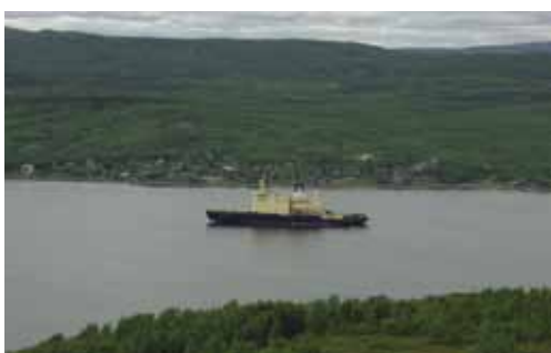
Экскурсия по Мурманску

Мурманская область активно участвует в различных проектах международного сотрудничества. Регион Баренцева моря включает в себя 13 регионов России, Финляндии, Норвегии и Швеции с населением около 5,5 миллионов человек.