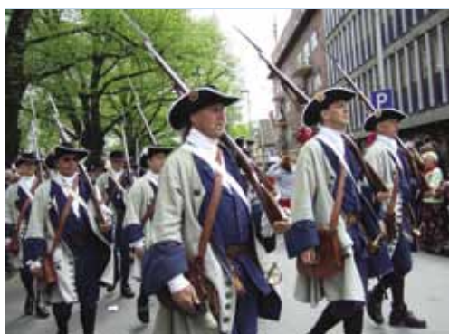
На праздновании Дня Независимости Норвегии (17 мая).

По итогам семинара были разработаны рекомендации, с которыми можно ознакомиться на сайте проекта BEN: http://www.benproject.org/repository/WP1/Fredrikstad_recommendations.pdf