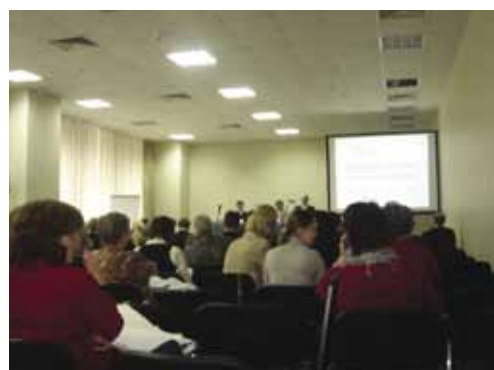
Консультации экспертов программы ИНТЕРРЕГ по написанию проектных заявок