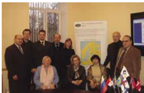
Представители партнерской сети BEN-East