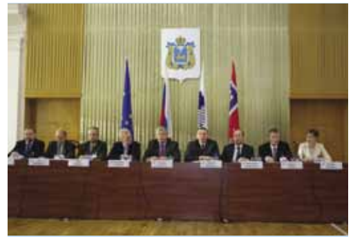
Открытие конференции.

В ходе конференции рассматривался широкий спектр вопросов, имеющих значение для приграничного сотрудничества России, Европейского союза и Норвегии. Обсуждались общие тенденции и перспективы делового сотрудничества приграничных регионов, перспективные сферы для межрегиональной кооперации, значение приграничного сотрудничества в социально-экономическом развитии территорий, практические вопросы маркетинга и продвижения проектов, развития транспортно-логистической инфраструктуры приграничных регионов.