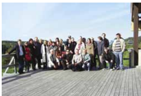
Участники семинара во Фредрикстаде на экскурсии.