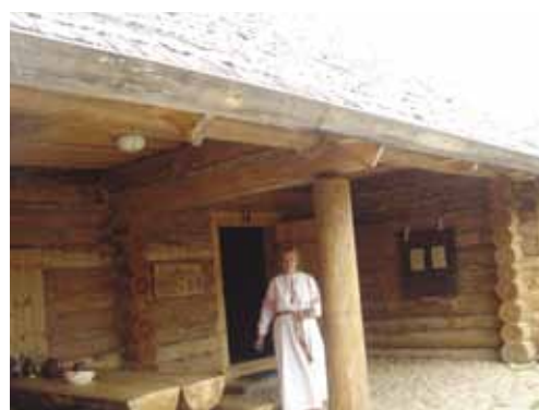
Экскурсия в музей Сету