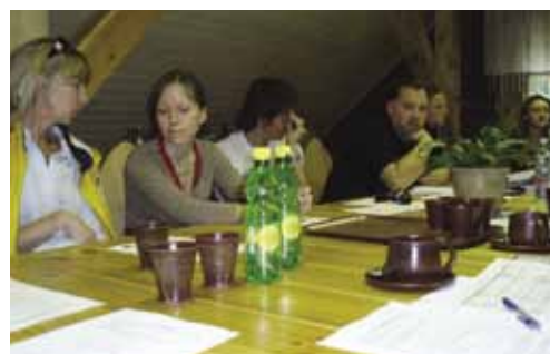
Участники Летней школы.

Подробнее о конференции и Летней школе: http://www.ctc.ee/index.php?menu_id=729&lang_id=2