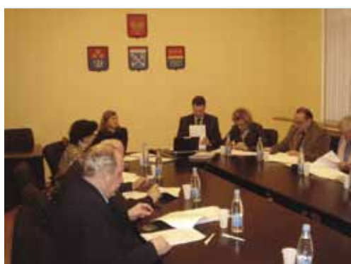
Третье заседание координационной группы проекта BEN-East