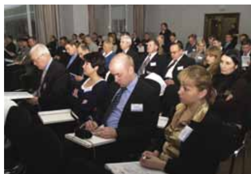
Пленарное заседание.

На двухдневном мероприятии были подведены итоги деятельности в рамках партнерской сети проекта, продемонстрированы лучшие примеры совместной проектной работы, а также представлены возможные направления дальнейшего развития приграничного сотрудничества в регионе Балтийского моря. Конференцию посетили представители правительства Российской Федерации и Республики Карелия, вузов и исследовательских организаций Северо-запада России и Республики Беларусь, Совета Министров Северных Стран, а также партнерской сети проекта.