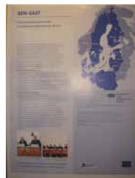
Презентация BEN-East на выставке проектов