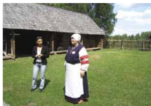
Посещение Музея Сету.